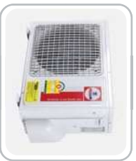
CONDENSING MODEL : CCS-IFE-1